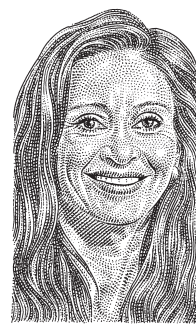
Cristina Fernández de Kirchner

para escrutar las actividades comerciales de los importadores y posiblemente presionarlos para que no importen más de lo que exportan, según el funcionario